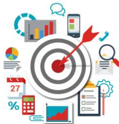
Menyusun rencana lomba