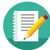
Pengisian log book lomba