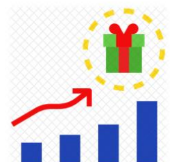
Mendapatkan insentif prestasi